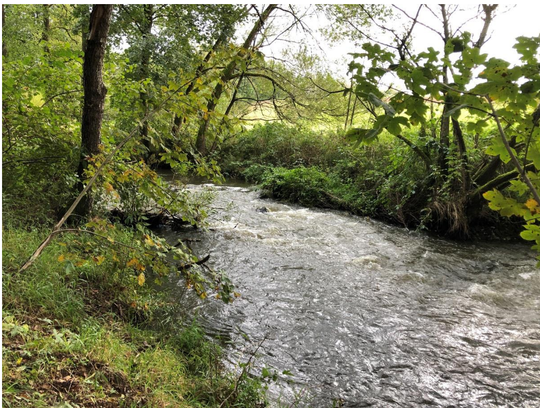
Obrázek 7 Jankovský potok.