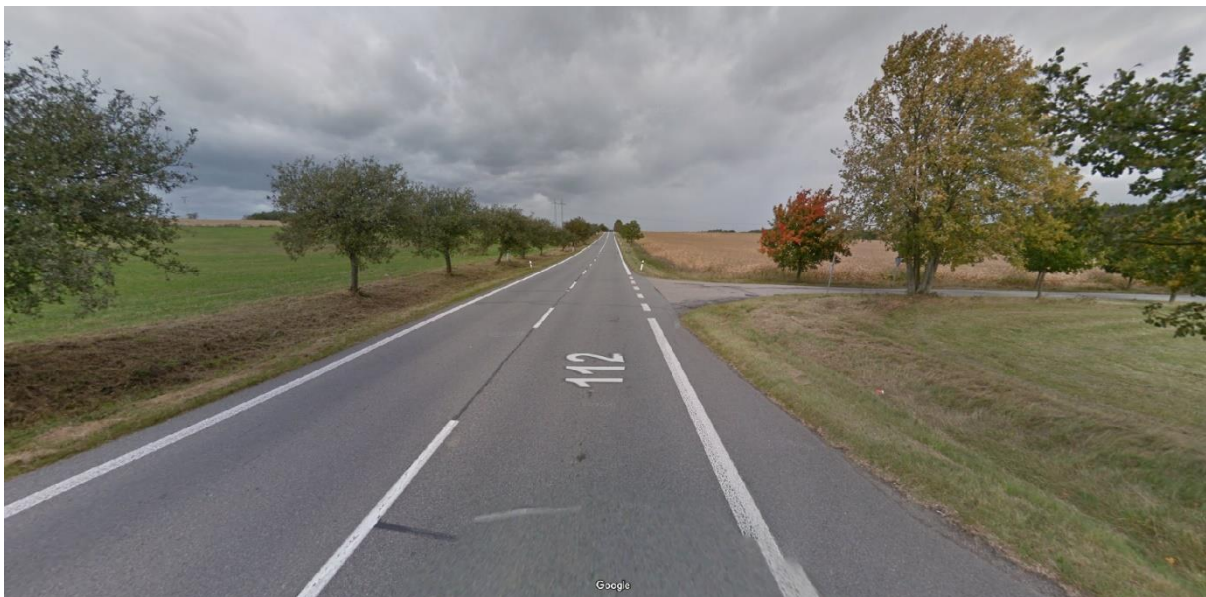
Obrázek 1 Křížení s komunikací II/112 – ZÚ.