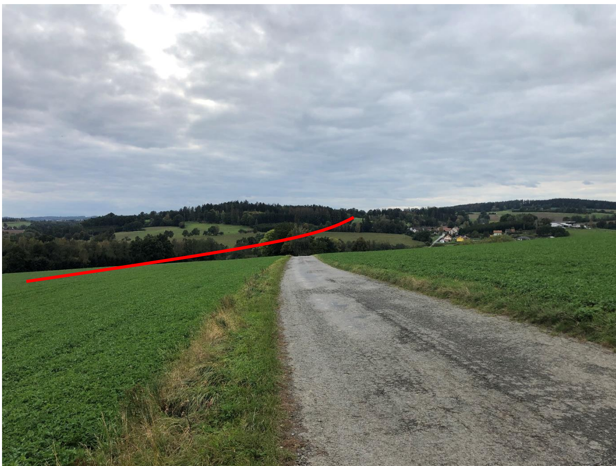
Obrázek 2 Pohled na údolí potoka Bělá u Krasíkovíc. Toto údolí bude překonáno mostní konstrukcí.