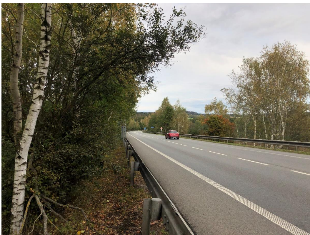
Obrázek 4 Pohled na místo křížení se silnicí I/34. V tomto místě bude vybudována mostní konstrukce překonávající navrženou trasu.