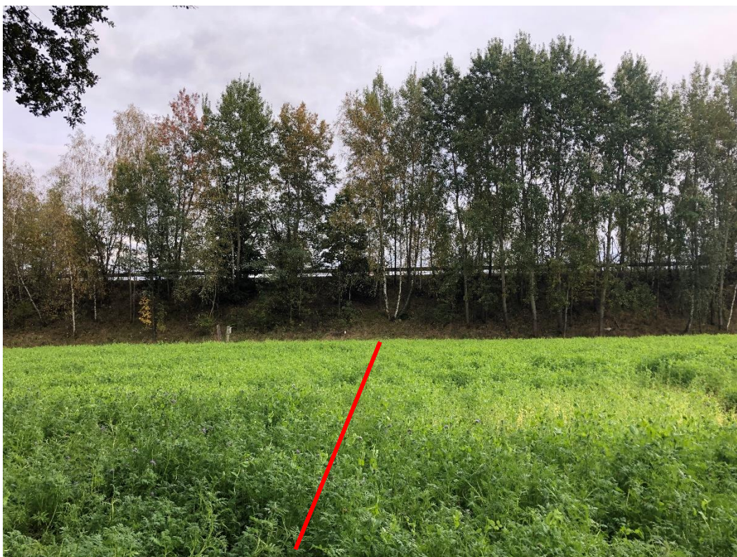
Obrázek 5 Těleso silnice I/34 v místě křížení s navrženou trasou. V tomto místě bude vybudována mostní konstrukce překonávající navrženou trasu.