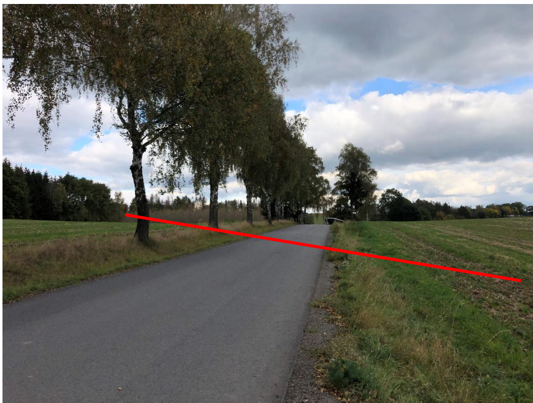
Obrázek 8 Místo křížení navrhované komunikace se silnicí III/12924. Tato komunikace bude přeložena.