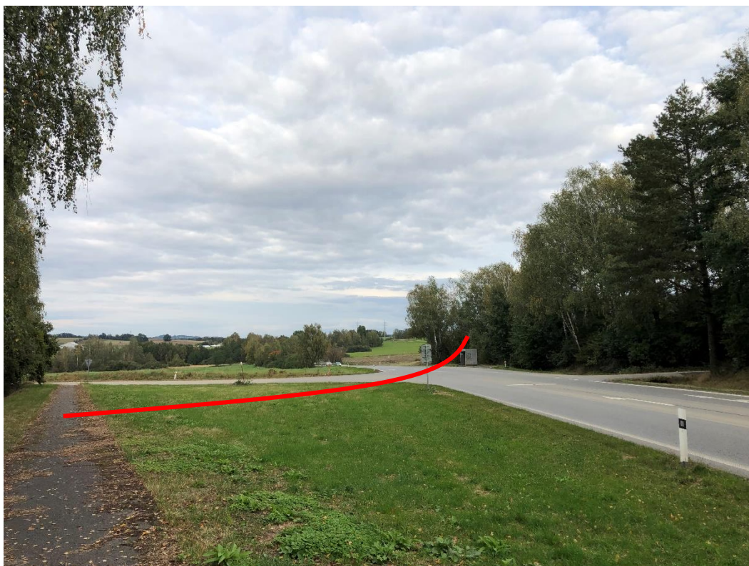
Obrázek 3 Křižovatka komunikací I/34 a III/03416. Křižovatka bude zrušena a komunikace přeloženy.