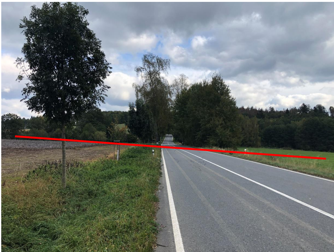
Obrázek 9 Místo křížení navrhované komunikace se silnicí II/129. Tato komunikace bude přeložena.